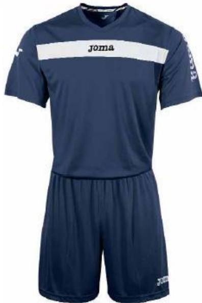
KIT5.901.02 Short Sleeve KIT5.991.02 Long Sleeve