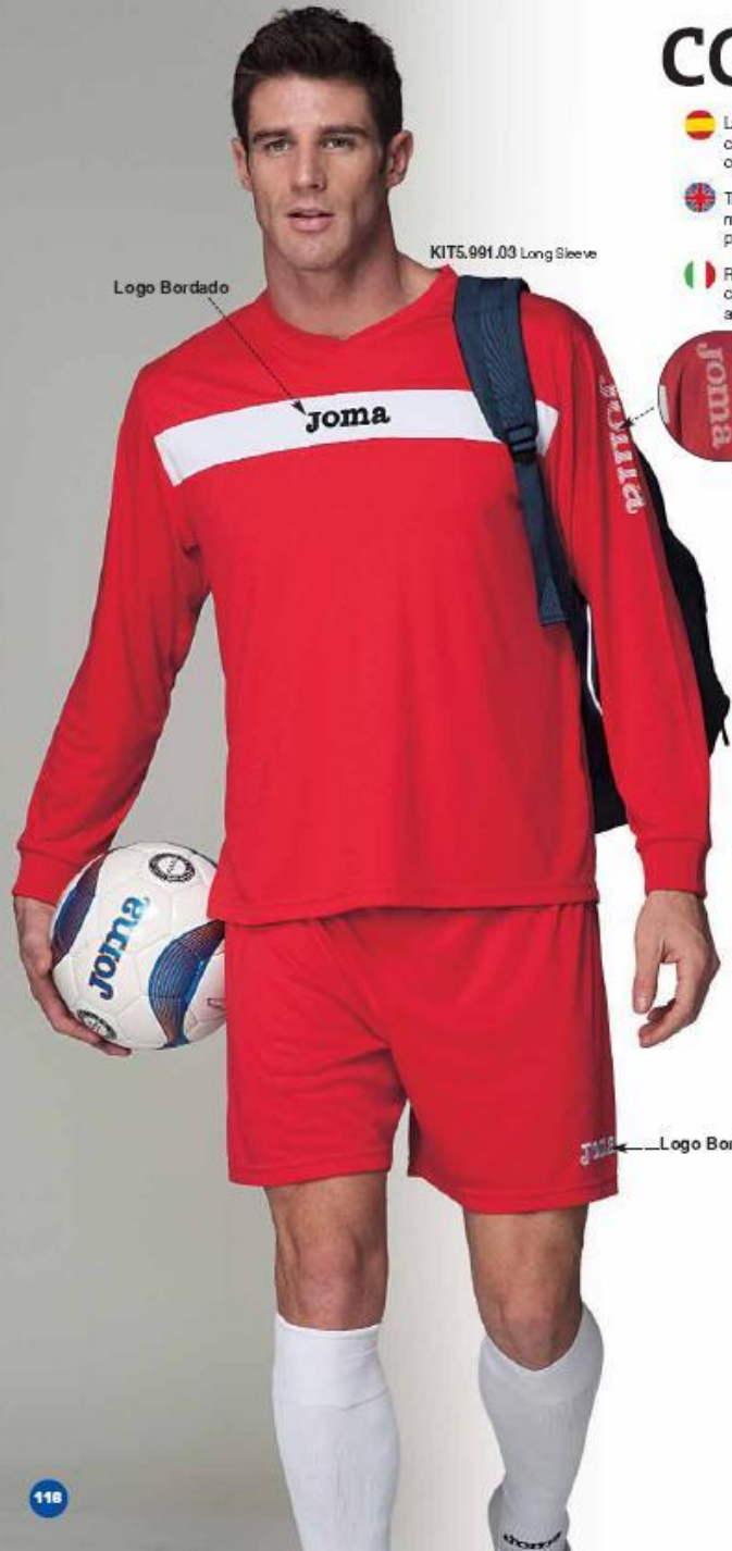
KIT5.991.03 Long Sleeve