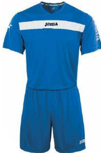
KIT5.901.01 Short Sleeve KIT5.991.01 Long Sleeve