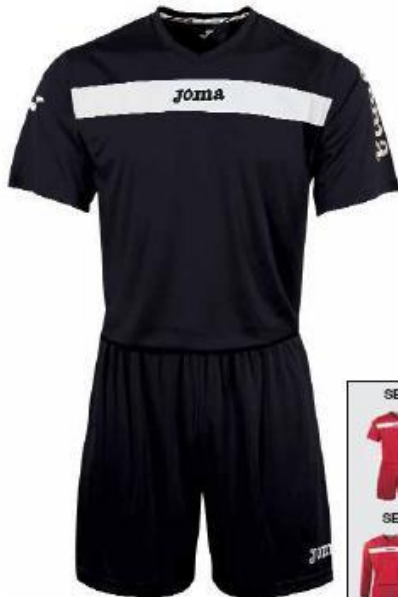
KIT5.901.04 Short Sleeve KIT5.991.04 Long Sleeve